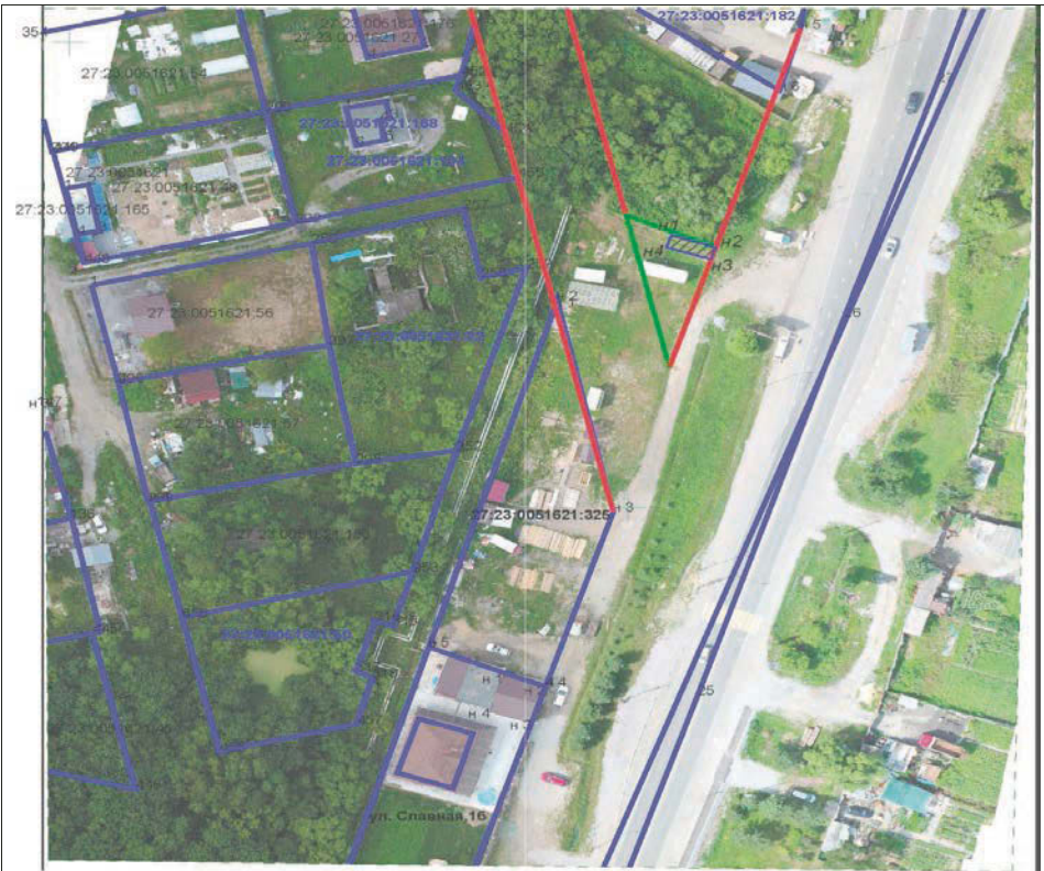
СХЕМА границ предполагаемых к использованию под размещение объекта земель на кадастровом плане территории

Приложение к постановлению администрации города Хабаровска от 23.11.2023 № 4640