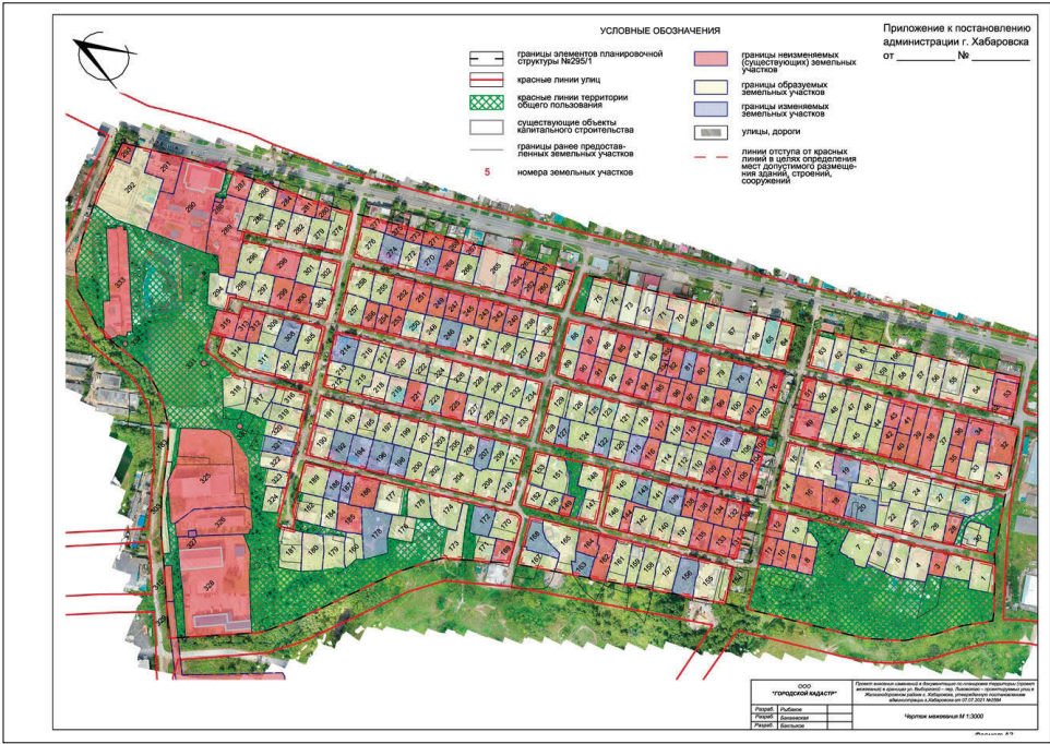
Основные характеристики и показатели проекта межевания

Приложение к постановлению администрации г. Хабаровска от 01.12.2023 № 4744