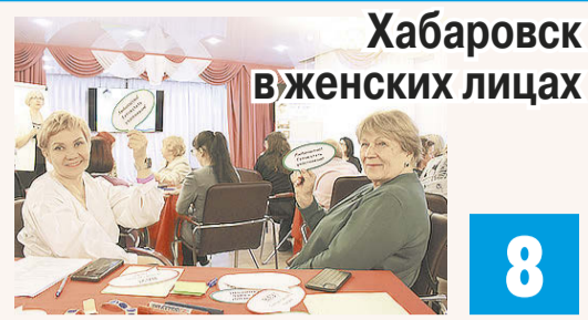
Хабаровск в женских лицах