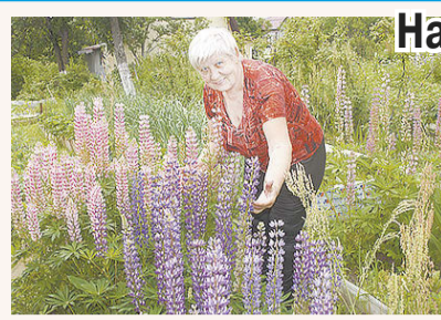
На своей земле