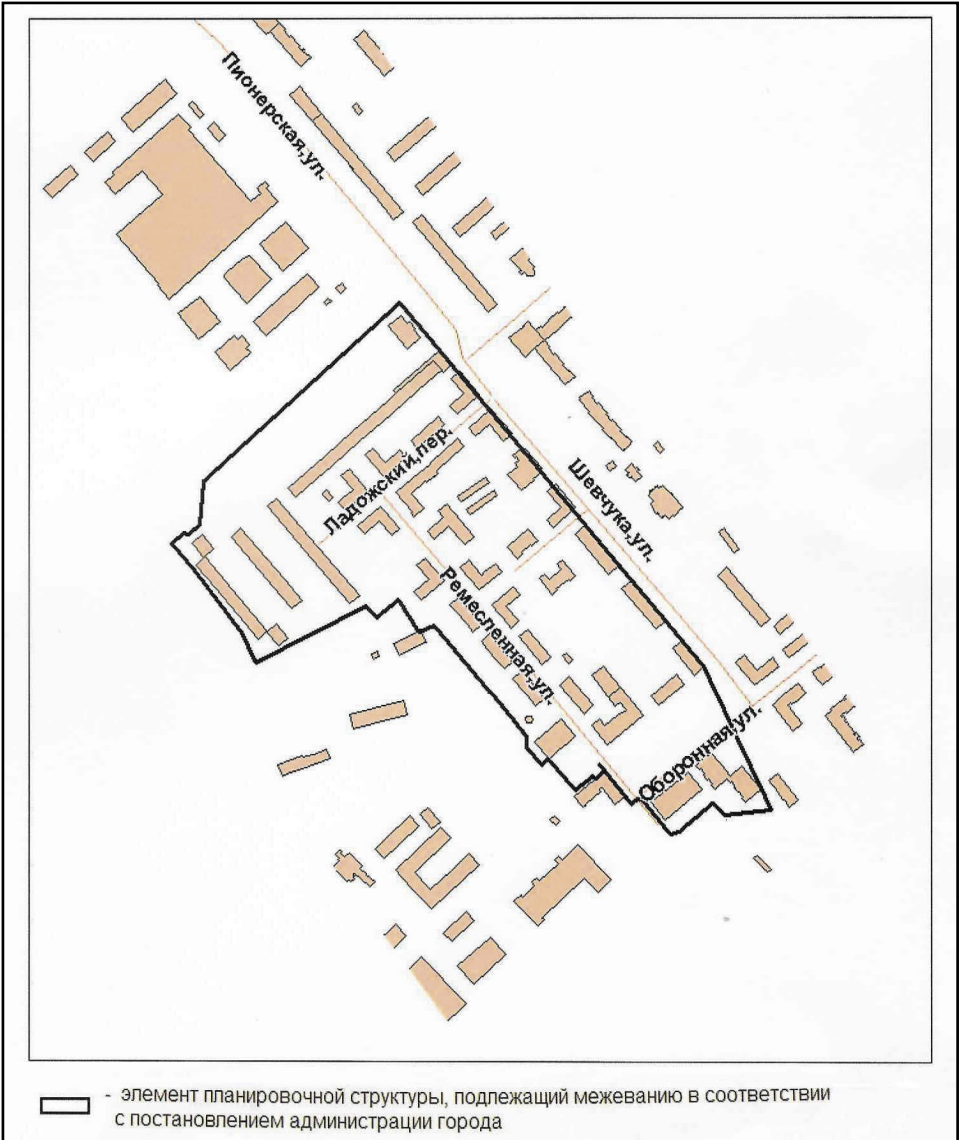
Схема расположения элемента планировочной структуры в границах ул. Шевчука — пер. Ладожского — ул. Ремесленной — ул. Оборонной в Индустриальном районе г. Хабаровска

Администрация города Хабаровска в лице департамента архитектуры, строительства и землепользования в целях соблюдения права человека на благоприятные условия жизнедеятельности, прав и законных интересов правообладателей земельных участков и объектов капитального строительства извещает о проведении публичных слушаний по рассмотрению документации по планировке территории (проект межевания) в границах ул. Шевчука — пер. Ладожского — ул. Ремесленной — ул. Оборонной в Индустриальном районе г. Хабаровска.