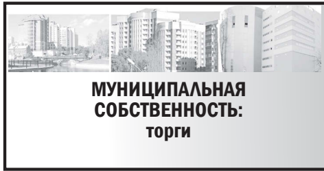
Приложение № 1 к конкурсной документации