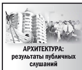
АРХИТЕКТУРА: результаты публичных слушаний