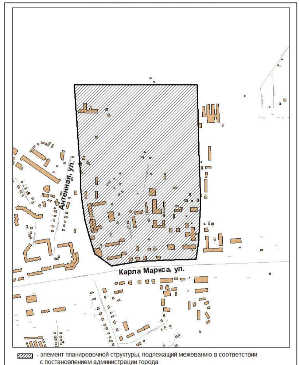
Схема расположения элемента планировочной структуры в границах ул. Карла Маркса — ул. Антенной — проектируемой улицы в Железнодорожном районе г. Хабаровска

/// - элемент планировочной структуры, подлежащий межеванию в соответствии с постановлением администрации города