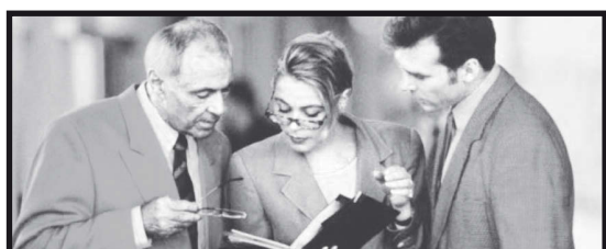
ИНФОРМАЦИЯ ДЛЯ НАШИХ ЧИТАТЕЛЕЙ