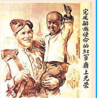
Слава Красной Армии — освободительнице!

В августовские дни 1945 года жители Хабаровска помогали частям Красной армии и Амурской флотилии в войне с империалистической Японией. Нашему городу, его заводам — судостроительному, «Дальдизелю», энергетического машиностроения, нефтеперерабатывающему, «Авторемлесу», железнодорожникам и речникам было предначертано сделать Хабаровск форпостом на дальневосточных рубежах. И эта задача была решена. Поэтому символично, что документ акта о безоговорочной капитуляции доставили именно в Хабаровск, а отсюда по закрытой связи текст был переслан в Москву.