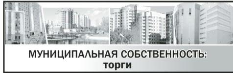
МУНИЦИПАЛЬНАЯ СОБСТВЕННОСТЬ: торги

Срок опубликования заключения о результатах публичных слушаний — 27.08.2021.