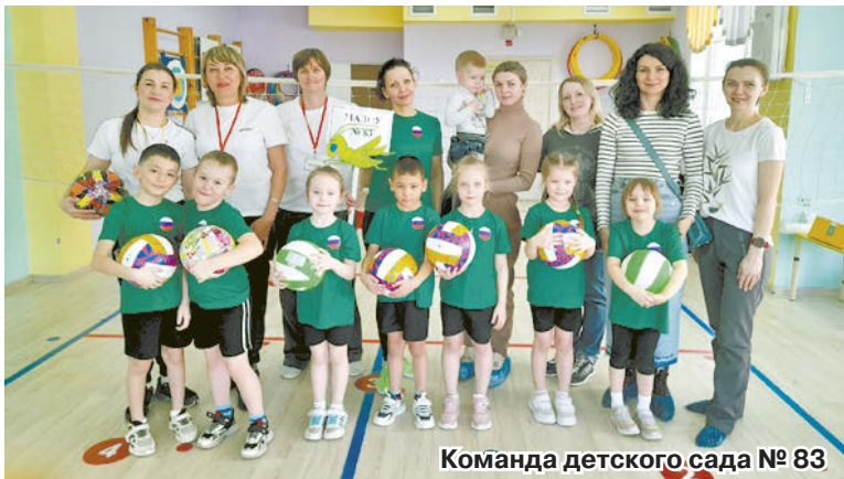
Команда детского сада № 83

детям с ОВЗ. Еще продолжаем занятия по программе «Маугли», уже в рамках общефизической подготовки. Также в детском саду открыта точка тестирования ГТО, и наши воспитанники успешно сдают нормативы. А с осени в подготовительной группе начали новое направление «Туризм» и даже ходили в настоящий поход до школы № 26 и обратно. Помимо педагогов, с детьми занимаются инструкторы туристических клубов, что им очень нравится.