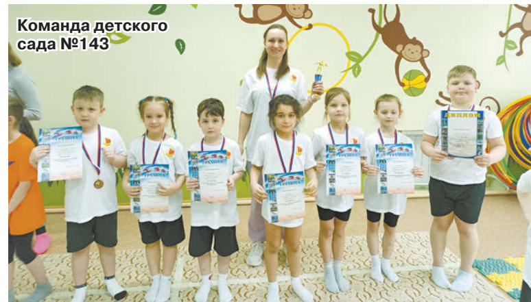
Команда детского сада № 143