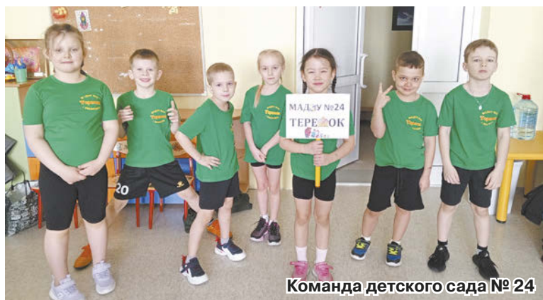
Команда детского сада № 24