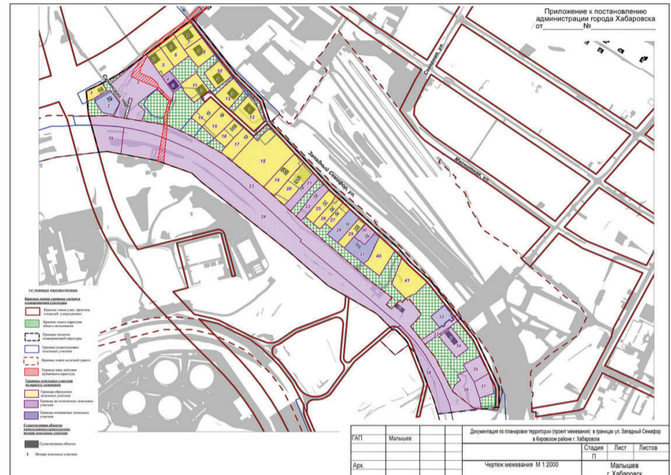
Приложение к чертежу межевания

Приложение к постановлению администрации города Хабаровска от 09.04.2024 № 1489