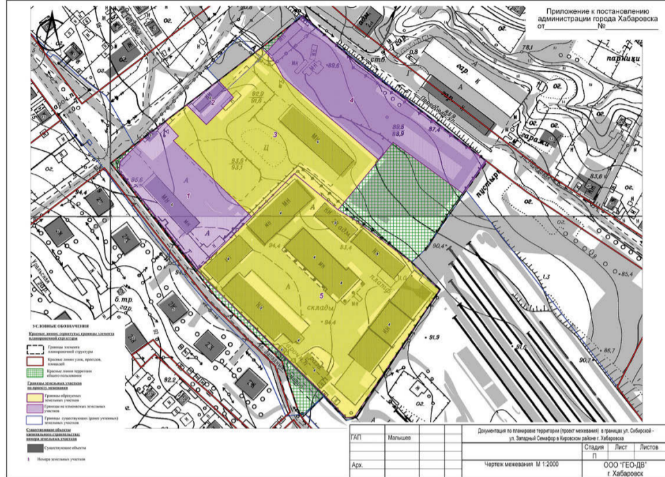
Приложение к чертежу межевания

Приложение к постановлению администрации города Хабаровска от 09.04.2024 № 1488